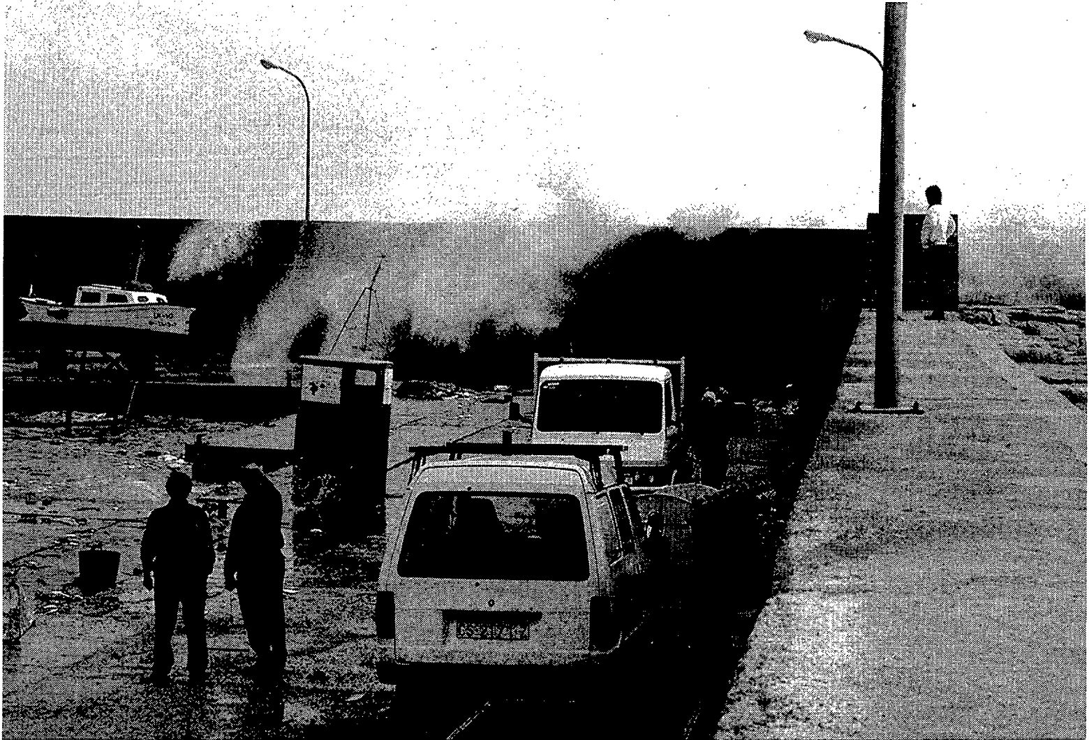
LES CASES D'ALCANAR. Parte de un dique del puerto se hundió por el temporal; las olas alcanzaron los tres metros y el viento sopló a más de 80 kilómetros por hora, lo que obligó a toda la flota a quedarse en el puerto

En las comarcas de Tarragona los daños e inundaciones fueron especialmente importantes en dos puntos: Les Cases d'Alcanar y el núcleo costero de Vilafortuny, en Cambrils, e obligó a prácticamente toda la flota a quedar-