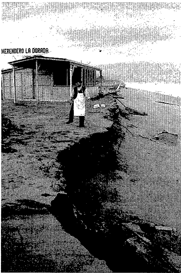
CABRERA DE MAR. Dos chiringuitos sufrieron importantes daños por el embate de las olas